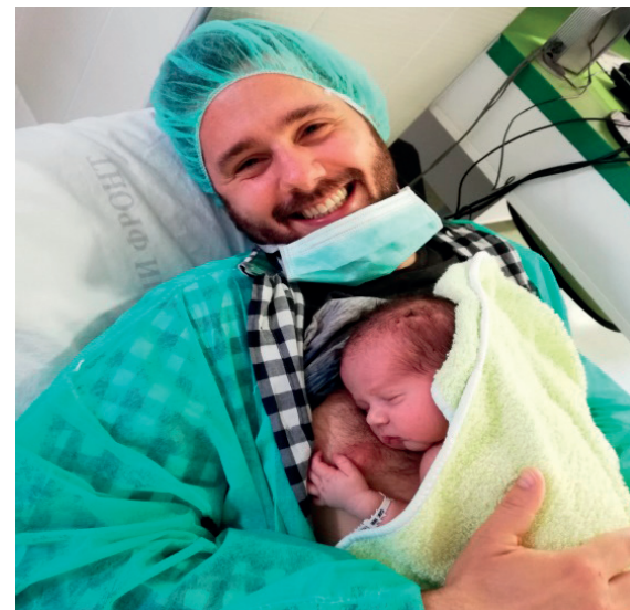
Fotografija 2. Kontakt „koža na kožu“, specijalno vreme sa tek rođenom bebom

Otac na fotografiji 2, kao i majke na fotografijama 3, 4, 5, su u posebnom kontaktu sa svojom bebom. Ovaj kontakt zovemo „Kontakt koža na kožu“- golišavo telo bebe (na-