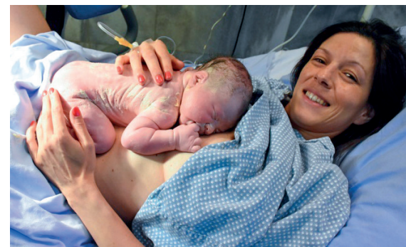
Fotografija 3. Kontakt „koža na kožu“, specijalno vreme sa tek rođenom bebom