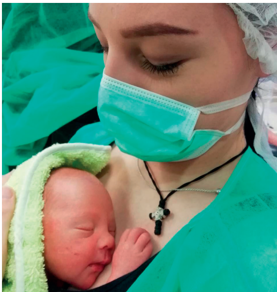
Fotografija 4. Kontakt „koža na kožu“, specijalno vreme sa tek rođenom bebom