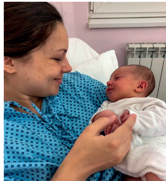
Fotografija 6. Razgovor sa bebom

Sa roditeljima možete govoriti i o načinima na koje bebe „pričaju“ pre govora, pa i pre vokalizacije: pokretima očiju, ruku ili celog tela, promenama izraza lica, pokretima usana ili celog lica, pokušajem vokalizacije (širenjem usta, „mljackanjem“) ili vokalizacijom, okretanjem očiju ili glave (kasnije ruku) ka izvoru zvuka - ka osobi koja govori, umiriva-