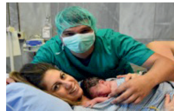
Fotografija 1. I otac i majka - staratelji od početka

Evo fotografija koje mogu biti podsticaj za razgovor sa porodicama o temama povezivanja i važnosti kvalitetnog odnosa sa oba roditelja: